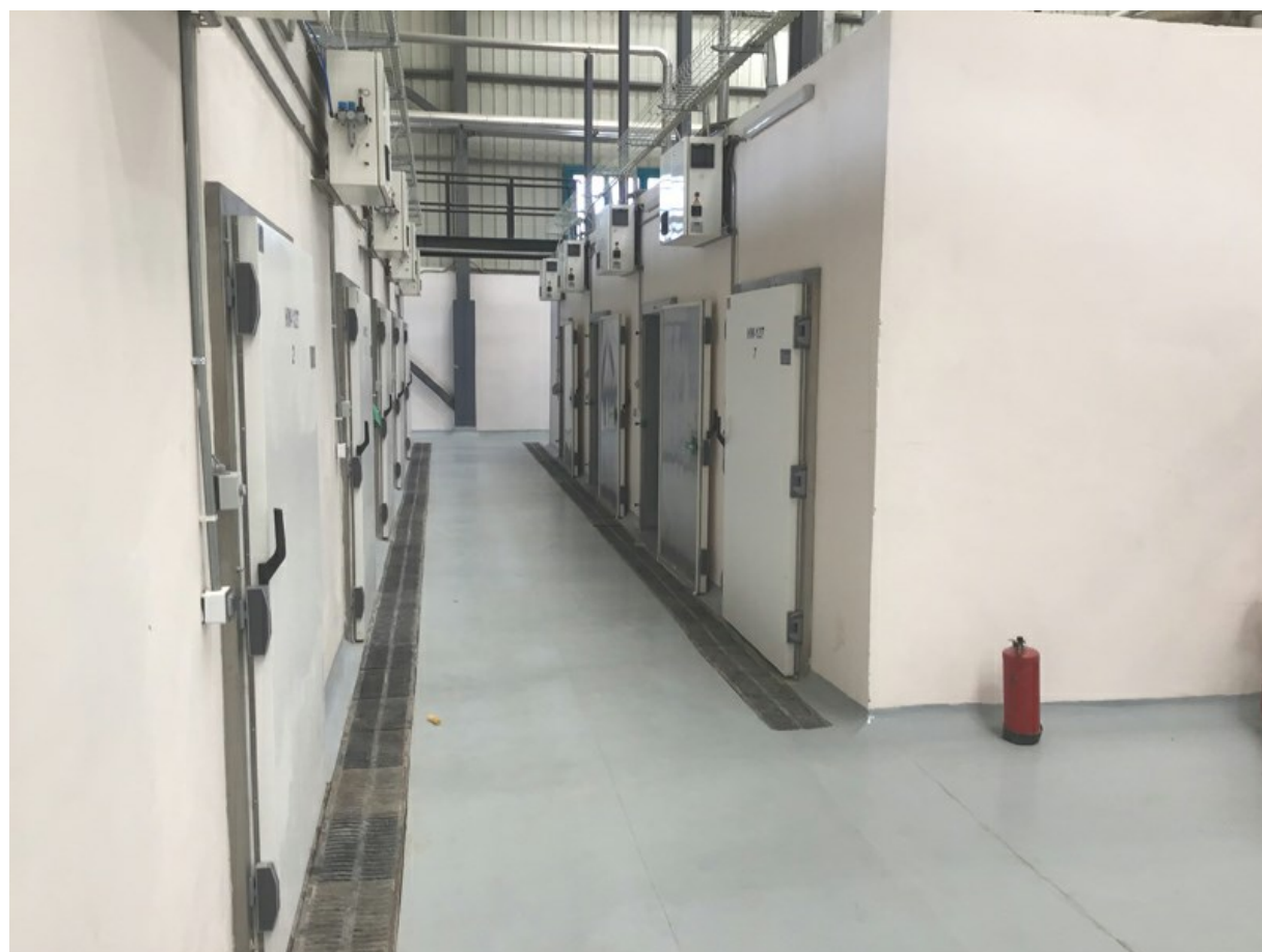
Kit per celle di essiccazione