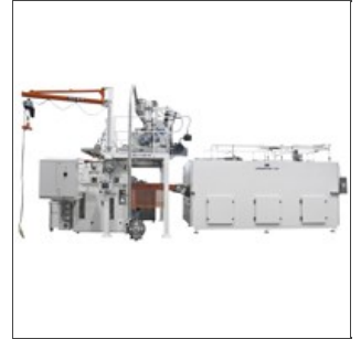
Longdryer su linea pasta lunga