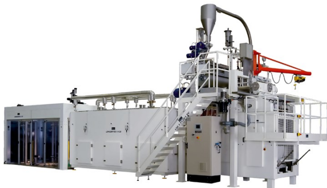
■ Longdryer su Linea pasta lunga