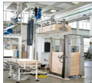
Robo XI: sistema robotizzato di fine linea (valida alternativa al Robo-T)