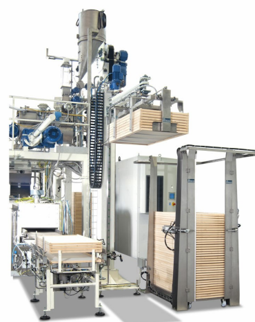
Robo XI: sistema robotizzato di fine linea