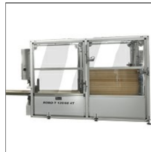
Impilatore telai Robo-T

In alternativa è disponibile il sistema robotizzato Robo XI .