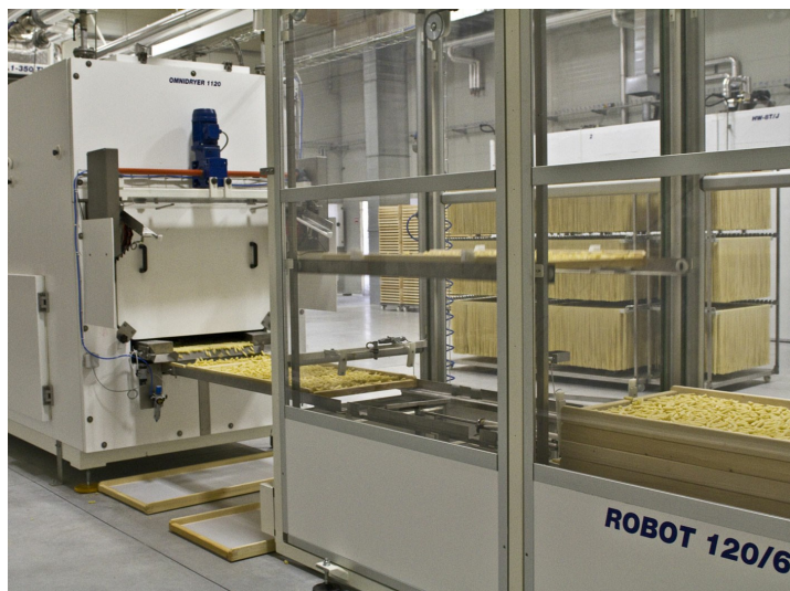
Impilatore telai Robo-T