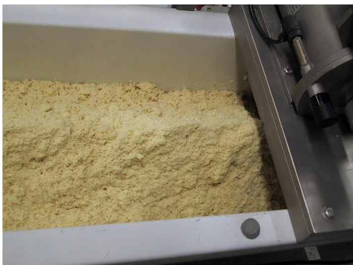
Impasto sul nastro