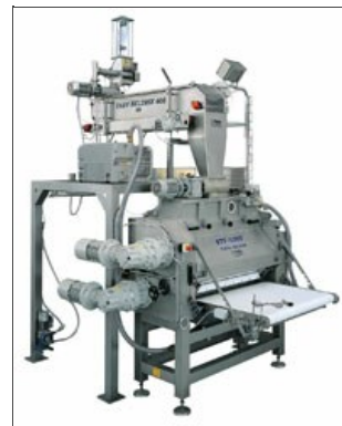
Applicazione Premix® su Beltmix

Attenzione alle imitazioni: non fatevi ingannare dai tentativi di imitazione del Premix® . Grazie ad una prova pratica sarà possibile testarne l'efficacia e l'autenticità. La nostra sala prove è sempre a disposizione, senza alcun impegno, per mostrare il funzionamento del Premix® utilizzando anche materie prime e ricette del cliente.