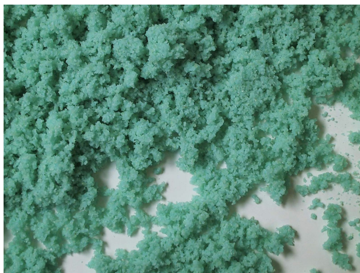
Impasto con colorante (blu di metilene)