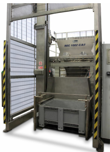
REC 1002 C/A/I