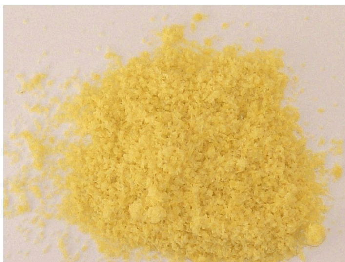
Prodotto tritato omogeneo