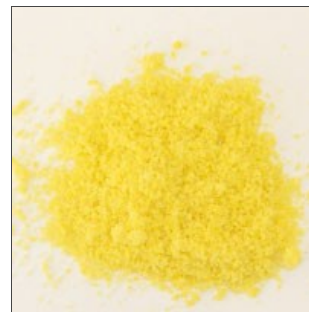
Prodotto tritato omogeneo