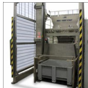
REC 1002 C/A/I