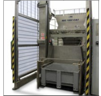
REC 1002 C/A/I