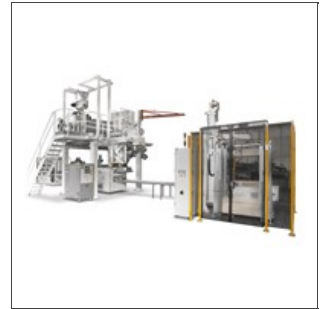
Prensa 180.1 en la línea de pasta corta