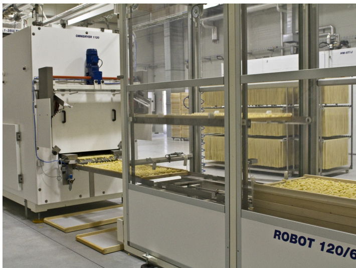
■ Apiladores bastidores Robo-T