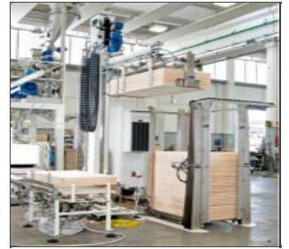
Robo XI: sistema robotizado de final de línea (válida alternativa al Robo-T)