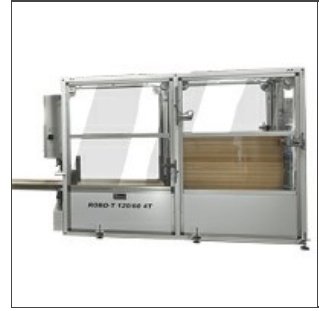
Apiladores bastidores Robo-T

Está equipado de una alarma que señala cuando el carro está completo y de paneles perimetrales con función de protección de seguridad. En alternativa está disponible el sistema robotizado Robo XI .