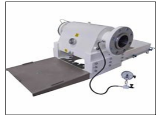
Tête pour pâtes courtes