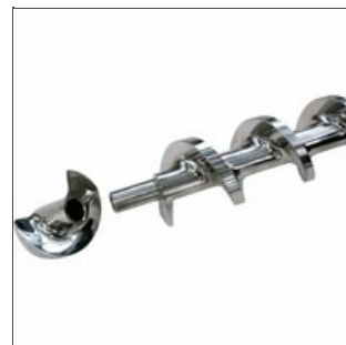
Détail vis de compression ouverte

Nous avons acquis une carte cognitive et, par conséquent, un patrimoine approfondi et historique de ces machines; tout cela nous permet d'apporter des améliorations technologiques de haut niveau , là où c'est nécessaire, et de pouvoir affirmer que le nom Braibanti est depuis toujours synonyme d'indestructibilité, et cela également grâce à nous.