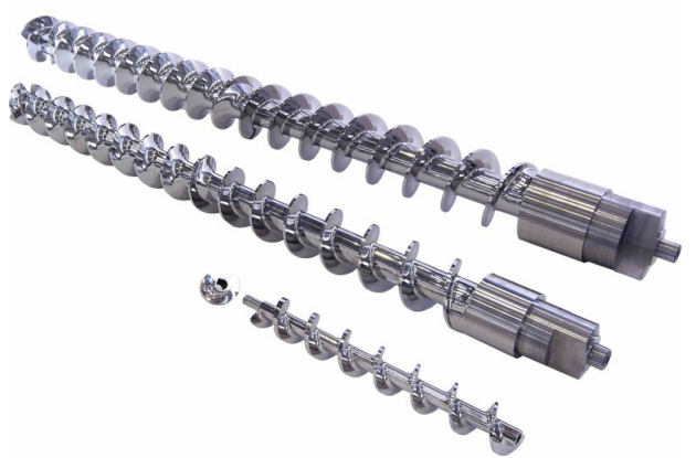
■ Vis de compression