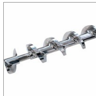
Détail vis de compression fermée