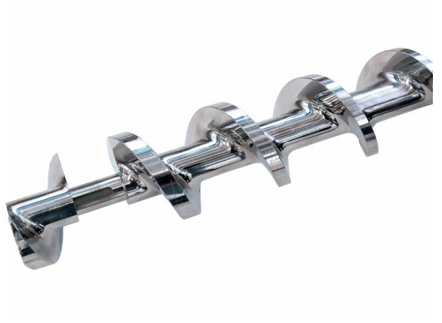
■ Vis de compression fermée