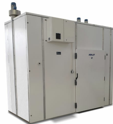
Celda de secado HW