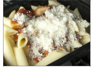
Fromage râpé sur les pâtes