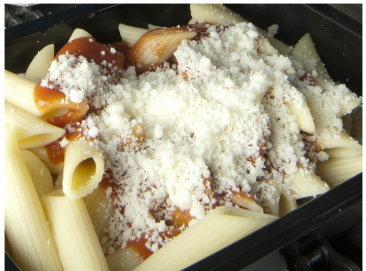
Fromage râpé sur les pâtes