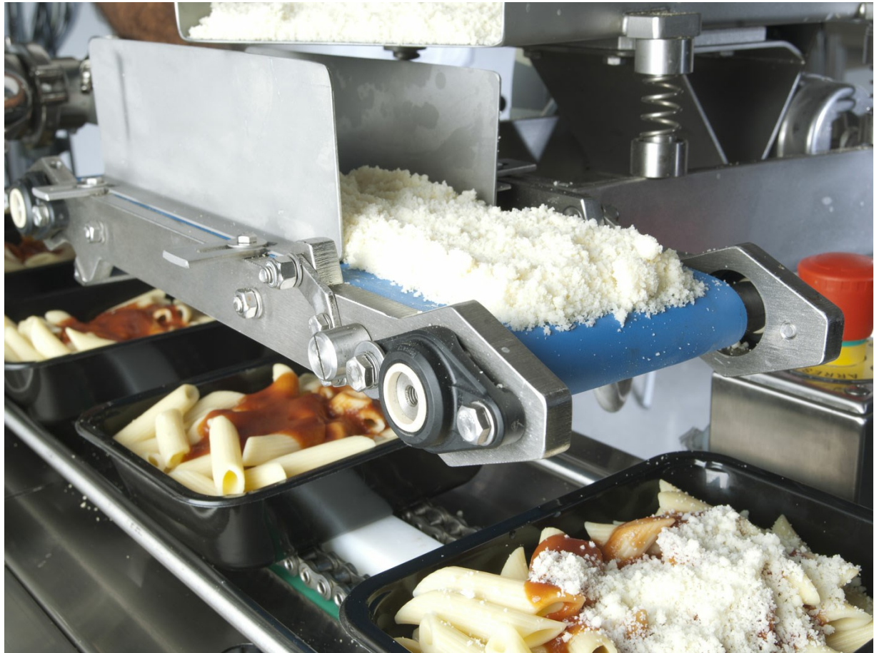
■ Détail du doseur pour fromages râpés