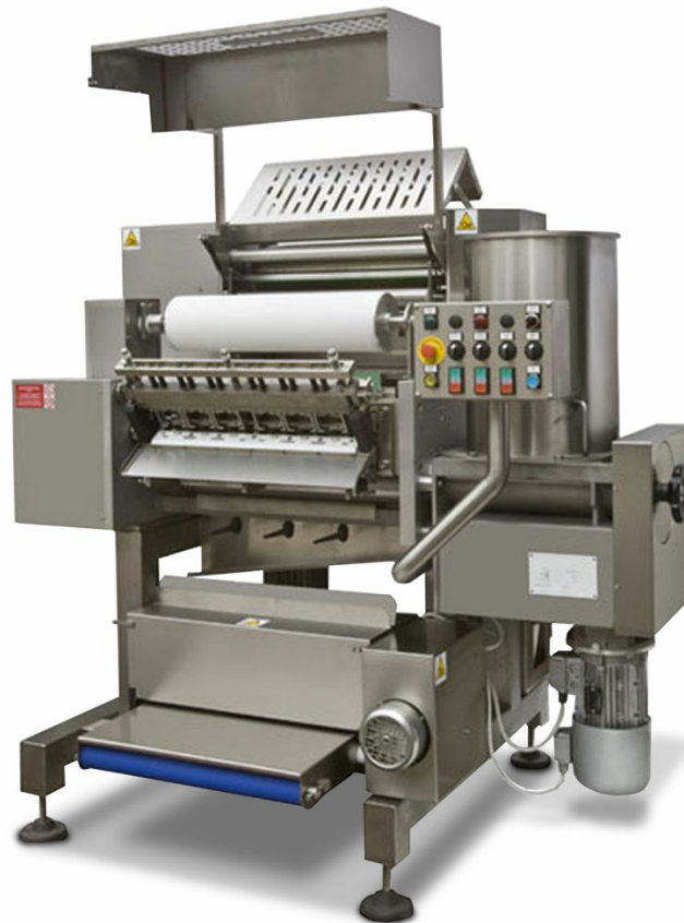
R 540 C