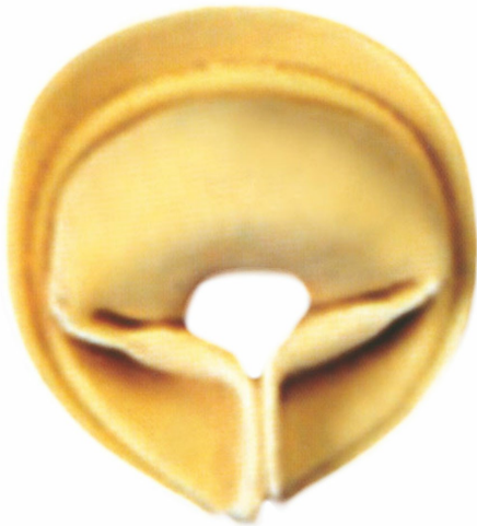
■ Cappelletto pinzato