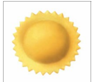
Ravioli rond à double feuille