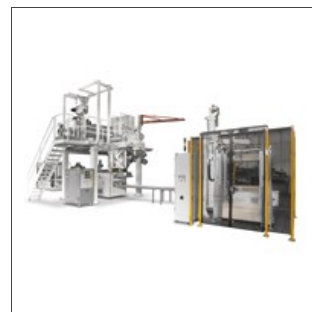
Presse 180.1 sur Ligne pâtes courtes