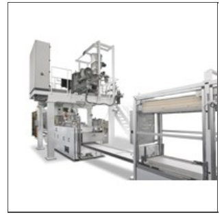
Prensa 180.1 - detalle